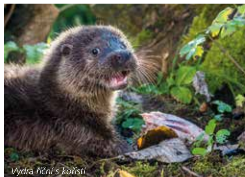
Vydra říční s kořisti