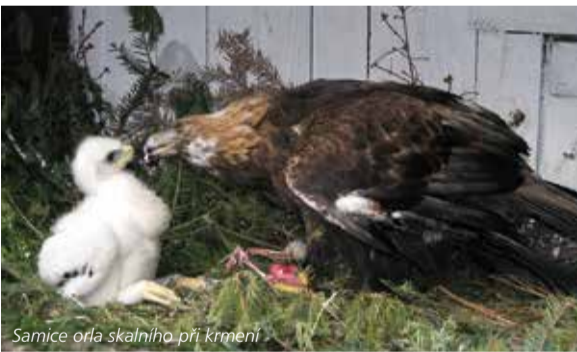
Samice orla skalního při krmení