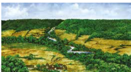
13. století n. l.

Současná historie Poodří začíná s koncem doby ledové před cca 11 000 lety. Ledovec tehdy zasahoval až k hlavnímu evropskému rozvodí v okolí Bělotína na Hranicku. Zůstaly po něm morény a ledovcové a jezerní usazeniny, kterými se po úplném ústupu ledovce prodírala k severu řeka Odra. Když se oteplilo, území osídlili lidé – lovci a sběrači. Kolem roku 6 000 před n. l. začalo