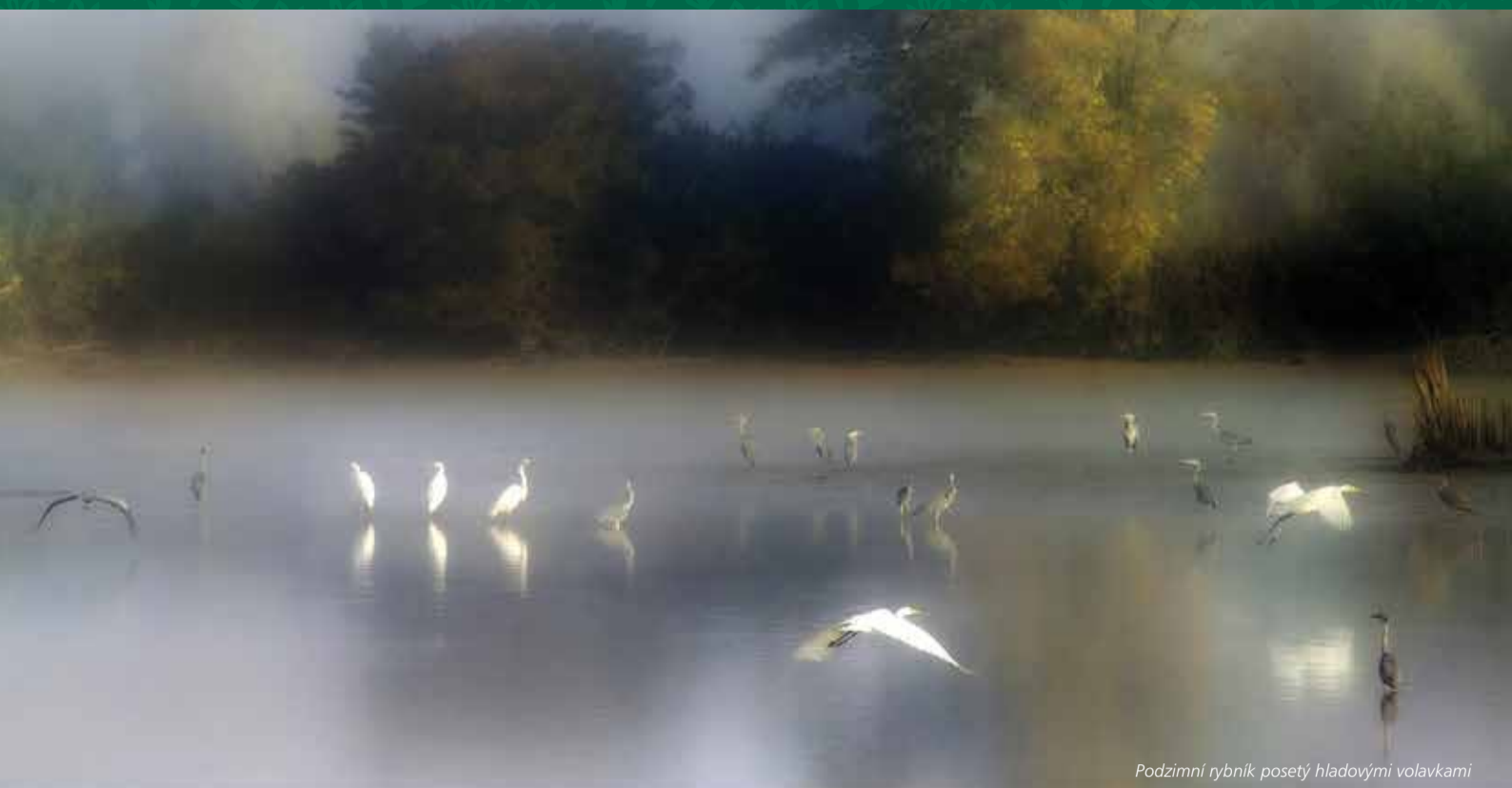
Podzemní rybník posetý hladovými volavkami

Vítejte v krajině rybníků, širých luk a lužních lesů, kterou se nespoutaný tok Odry vine v nesčetných meandrech jako had. Rozlehlé louky podél řeky se v Poodří zachovaly díky pravidelným záplavám, podobně jako lužní lesy a tůně v odstavených ramenech. Během tisíciletí se člověk v nivě naučil hospodařit a naučil se i respektu k vodnímu živlu. Vznikla tak harmonicky utvářená krajina, kde přirozené vodní toky doplňuje řada náhonů a struh, které dříve poháněly mlýny a pily a zásobovaly vodou rozsáhlé rybníční soustavy, z nichž mnohé zdobí krajinu Poodří dodnes.