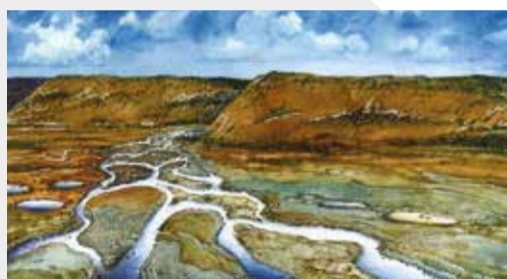
9 000 př. n. l.

Vítejte v krajině rybníků, širých luk a lužních lesů, kterou se nespoutaný tok Odry vine v nesčetných meandrech jako had. Rozlehlé louky podél řeky se v Poodří zachovaly díky pravidelným záplavám, podobně jako lužní lesy a tůně v odstavených ramenech. Během tisíciletí se člověk v nivě naučil hospodařit a naučil se i respektu k vodnímu živlu. Vznikla tak harmonicky utvářená krajina, kde přirozené vodní toky doplňuje řada náhonů a struh, které dříve poháněly mlýny a pily a zásobovaly vodou rozsáhlé rybníční soustavy, z nichž mnohé zdobí krajinu Poodří dodnes.