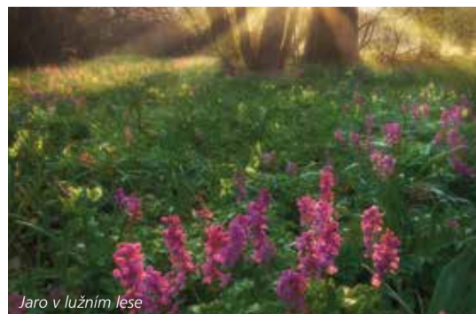
Jaro v lužním lese