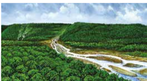
6 000 př. n. l.