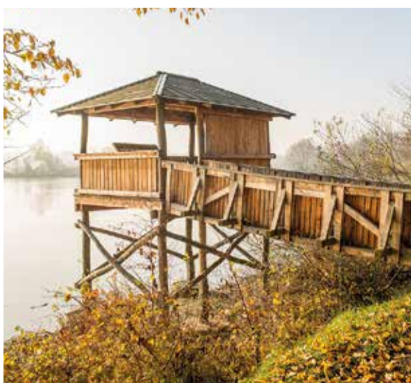
Ptačí pozorovatelna u rybníka Kotvice

Naučná stezka vás provede přírodní rezervací Kotvice u Studénky. Na necelých čtyřech kilometrech poznáte Poodří jako zajímavou a rozmanitou krajinu, která se společným vlivem člověka a přírody neustále mění, ale přesto si zachovává svůj půvab a přírodní bohatství. Na devíti panelech mezi Novou Horkou a Pasečným mostem se dozvíte mnoho zajímavého o historii místa i obyvatelích oderské nivy. U rybníka Kotvice, významného hnízdiště ptactva, najdete ptáčí pozorovatelnu vysunutou nad vodní hladinu. Maskotem stezky se stala vydra říční, která je hlavní hrdinkou komiksového stripu, jenž najdete na každém zastavení.