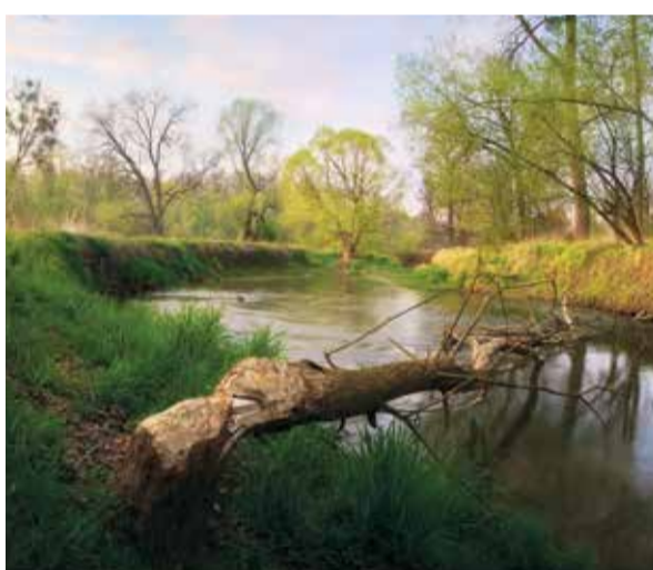
Bobrem pokácený strom u řeky Odry

Naučná stezka vás provede skutečnou krajinou povodní – údolní nivou mezi Jeseníkem a Suchdolem. Trasa začíná u Jeseníckého rybníka na levém břehu Odry. Na první pohled upoutají netradiční infopanely vyrobené z naplaveného dřeva, jakoby právě vytaženého z řeky. Hravé, komiksové zpracování se zalíbí především dětem, ale dokáže oslovit i dospělé. Na každém zastavení najdete nějaký interaktivní prvek či praktickou ukázkou: horniny z Poodří, bobří okusy, zvonkohru... Dozvíte se o tom, jak tato krajina vznikala, jak se o ni správně starat a kdo jsou její chytění i nechtění obyvatelé. Na stezce krajinou povodní se nudit nebudete, ale dejte pozor, aby zrovna nebyla pod vodou.