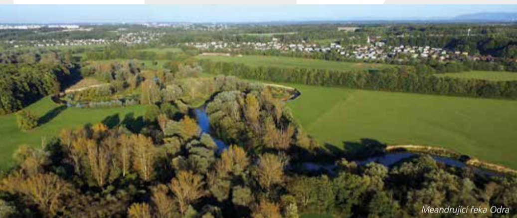
Meandrující řeka Odra

druhá, tentokrát převážně německá. Do 14. a 15. století je datován vznik rybníčních soustav, které dnes zahrnují rybníky o celkové ploše téměř 700 ha. Většina z nich je napájena umělým kanálem nazývaným Mlýnka, dlouhým přes 20 km. První zprávy o tomto díle jsou už z druhé poloviny 15. století, a je tedy starší, než mnohem známější Zlatá stoka na Třeboňsku.