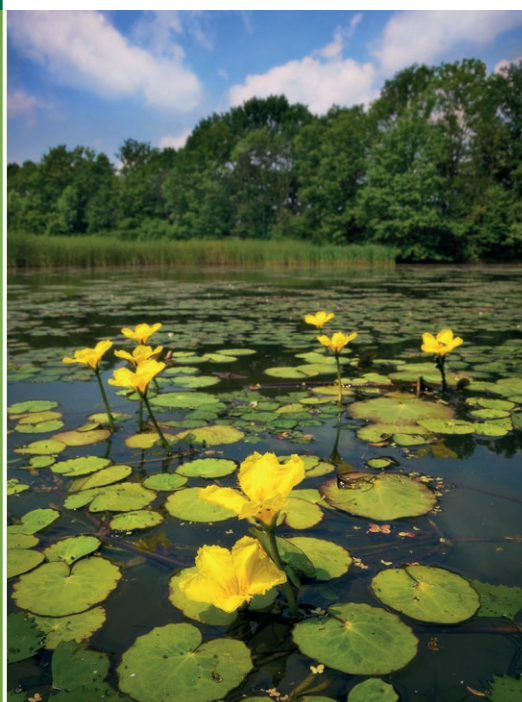
Plavín štítnatý

V Poodří je veškerý život vázán na vodu. Stovky tůní, starých říčních ramen a rybníků umožňují rozmnožování četným obojživelníkům. Uslyšíte tu především kuňky, rosničky a všudypřítomné skokany skřehotavé. Jarní rozlivy Odry jsou podmínkou pro složitý životní cyklus vzácného koryše žábbronožky sněžní. Ta vyžaduje přeplavení a opětovné vyschnutí tůní, ve kterých klade vajíčka. Rozsáhlé rybníční plochy hojně využívají vodní ptáci, ať už k hnízdění, nebo jako vítanou zastávku na tahu. Na obloze Vás může zaujmout kymácivý let motáka pochopa, který hnízdí v rákosinách, a stal se proto symbolem zdejší rybníčné krajiny. V posledních letech si Poodří oblíbili také bobří a vydry.