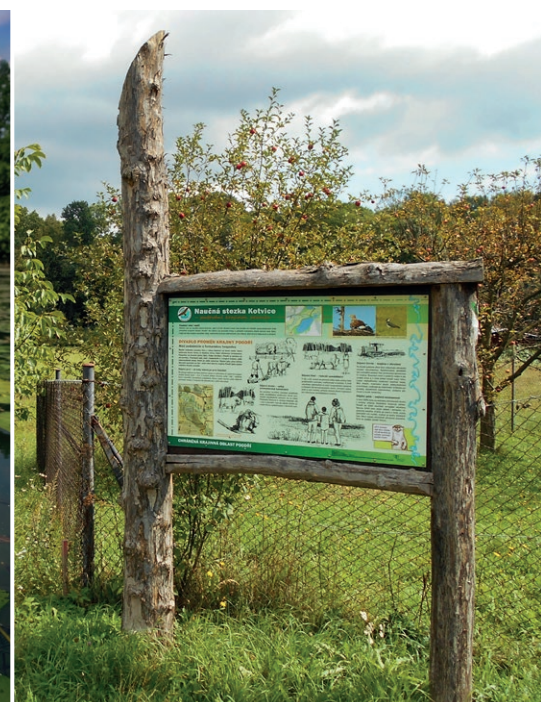
Naučná stezka Kotvice

Poodří je krajinou nesoucí výrazné stopy lidské činnosti. Lidé zakládali rybníky, sadili stromy, přepásali a kosili louky. A lidé musí krajinu udržovat i dnes. Jinak by se rybníky zanesly bahnem a louky zarostly náletem dřevin. O přírodu a krajinu v Poodří pečujeme také my. V zemědělské krajině vysazujeme stromy a zajišťujeme pravidelné sečení luk. Budujeme nové tůně pro rozmnožování obojživelníků. Pomáháme s rozdělováním dotací, které mohou ve prospěch naší přírody a krajiny využívat obce, spolky i jednotlivci. Péče o Poodří se neobejde bez spolupráce s vlastníky, místními hospodáři a nadšenci. Děkujeme také Vám, že nám Poodří pomáháte chránit.