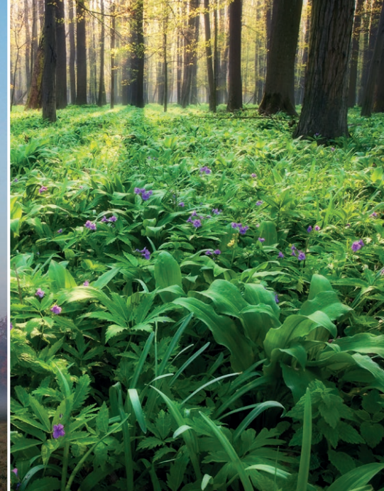
Lužní les s rozkvetlou kyčelnicí

Skutečnou krásu Poodří oceníme až při pohledu shora. V nekonečných loukách se klikatí zelené hájky upomínající na zaniklá říční ramena, pouze místy se objeví větší kus lužního lesa. Louky a lesy přerušují četné rybníční soustavy s hrázemi posetými staletými duby. Na roztodivné tvary meandrů Odry s náplavy navazují odstavená říční ramena, to vše za doprovodu lužních porostů vrb. Zdejší krajina je pestrá a díky zachovalému vodnímu režimu stále funguje její propojení s nespoutanou řekou – Odrou. Kéž bychom se mohli nad krajinou kdykoliv proletět, ale i pohled do mapy udělá své.