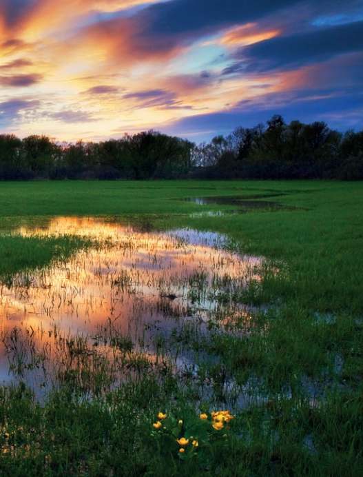
Rozliv Odry v loukách

Krajina rybníků, širých luk a lužních lesů, kterou se nespoutaný tok Odry vine v nesčetných meandrech jako had. Krajina, kde se řeka volně rozlévá do okolí, zaplavuje louky i lužní lesy, a spoluutváří tak unikátní mokřadní území – Oderskou nivu.