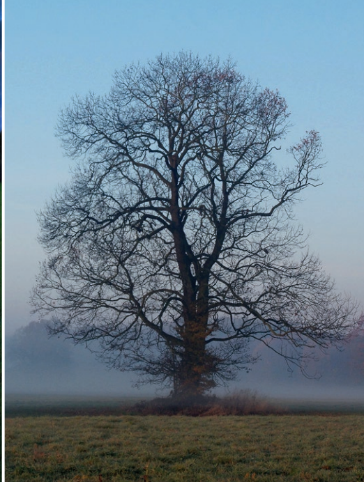
Dub solitér

Krajina rybníků, širých luk a lužních lesů, kterou se nespoutaný tok Odry vine v nesčetných meandrech jako had. Krajina, kde se řeka volně rozlévá do okolí, zaplavuje louky i lužní lesy, a spoluutváří tak unikátní mokřadní území – Oderskou nivu.