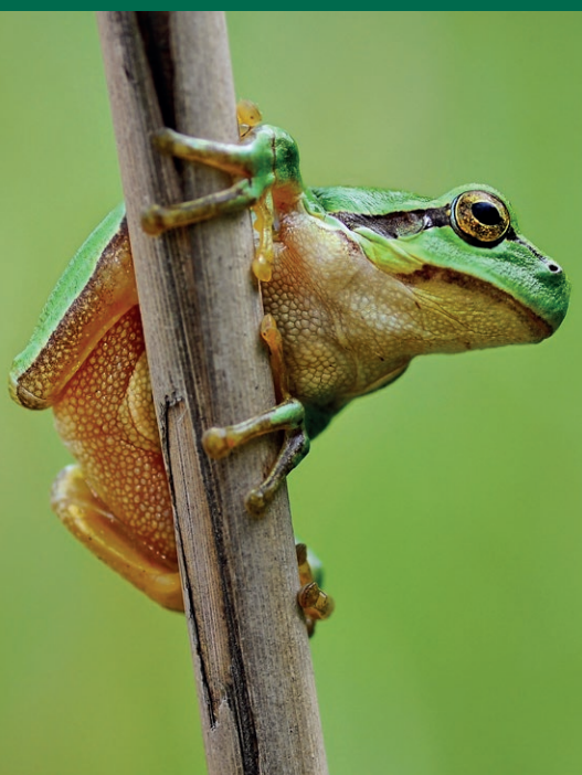
Rosnička zelená

Jaro v Poodří je plné pestrobarevných květů. V únoru se pod neolistěnými stromy objeví bílá záplava sněženek, v dubnu fialové kyčelnice, žlutozelené hvězdnatce či dymnivky a nakonec v květnu rozkvetou i zavoní česneky medvědí. V létě pak najdeme ty nejzajímavější rostliny v rybnících a tůních. Kotvice plovoucí s ostnitymi „orišky“ či vzácná vodní kapradina nepukalka rostou v takovém množství jen u nás v Poodří. Vzácný plavín štítnatý vystavuje na hladině rybníku své zlatavé květy a drobné živočichy zde chytá vodní „masožravá“ rostlina bublinatka. V tůních můžeme obdivovat především žluté květy stulíků.