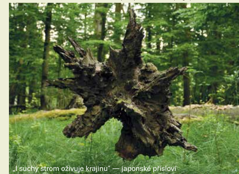
„I suchý strom oživuje krajinu“ — japonské přísloví